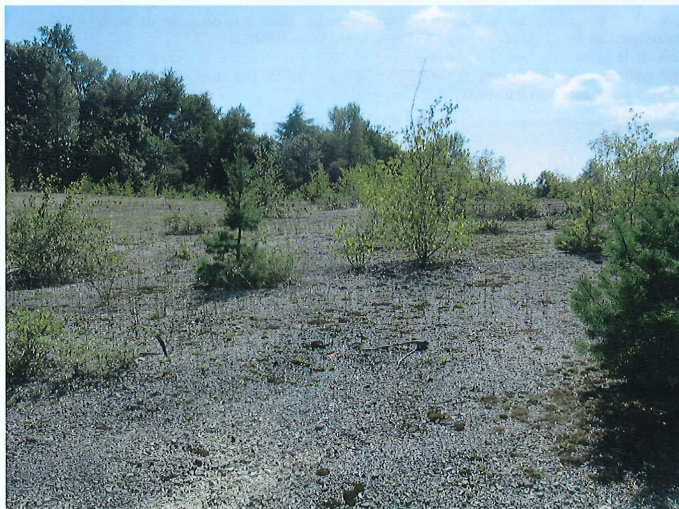
^ Vues d' ensemble prises au centre de l' emprise du projet (orientations vers Nord-Ouest et vers Nord Est)