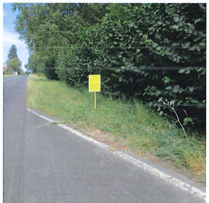
^ Affichage complémentaire demandé